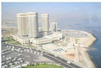
Libya with Gaddafi