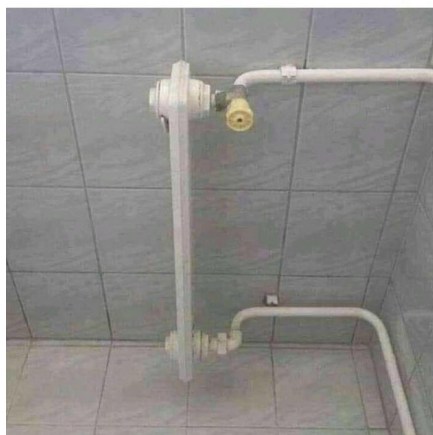
Radiátor ...model roku 2022